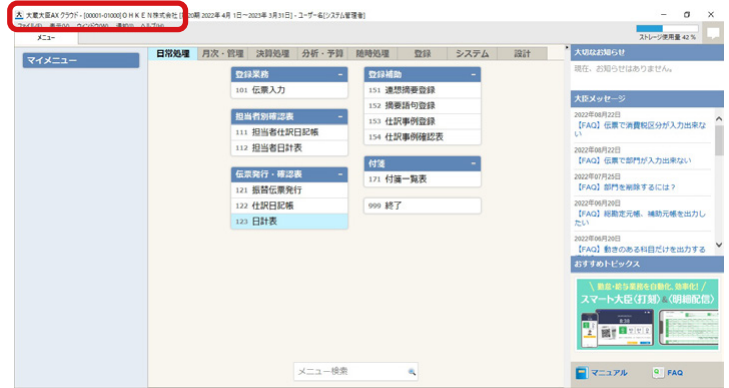
大臣 AX シリーズ