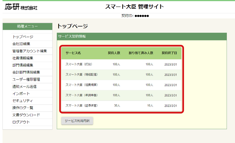
スマート大臣 管理サイト